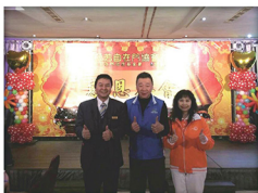
20180112_ 花蓮弘光尾牙餐會