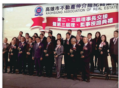
20171214_ 高雄市理事長新理監事上任