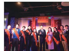
20180207_ 新豐湖口幸福聯營團隊尾牙