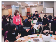
20180207_ 代書松山南港聯合餐會