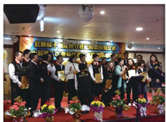
20180119_ 宜蘭會員大會及各店東聚會