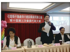
20171216_ 花蓮仲介公會會員大會