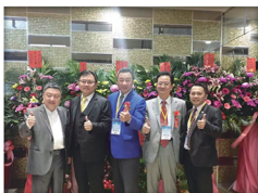
20180120_ 台東理事長當選交接大會