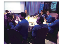
20180307_ 東龍不動產總部春酒